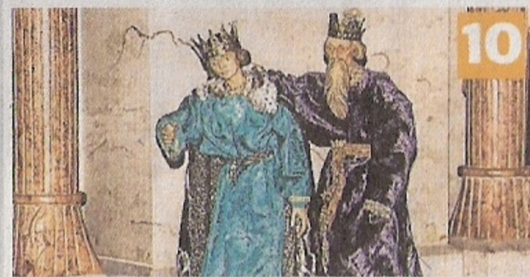
St. Anna Schaag