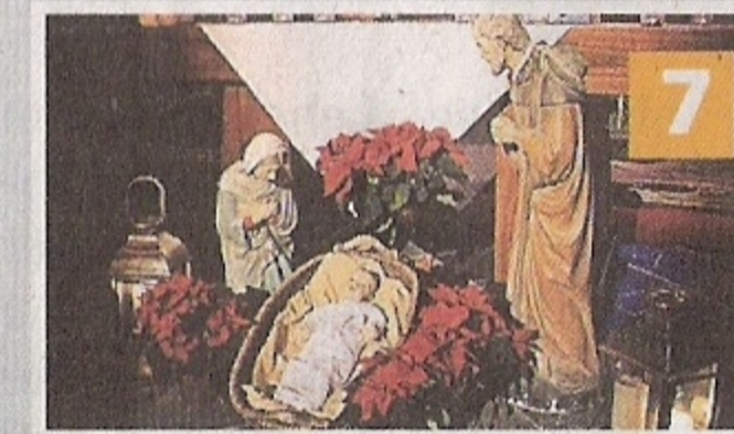
Alte Kirche Lobberich