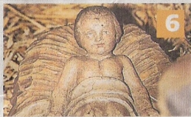
St. Peter und Paul