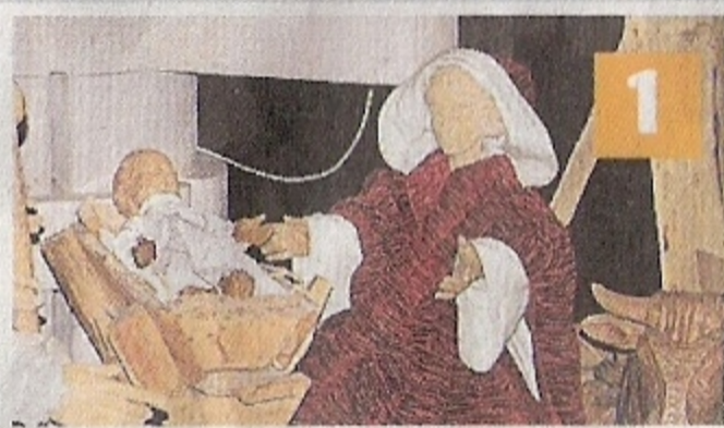
St. Lambertus Breyell