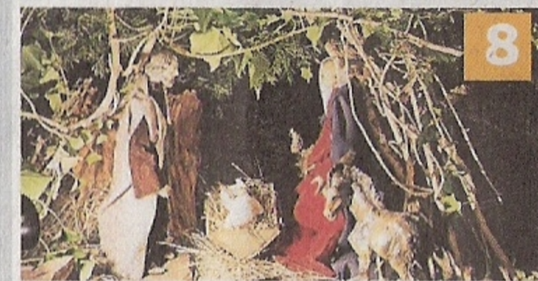
Krankenhaus- kapelle Lobberich