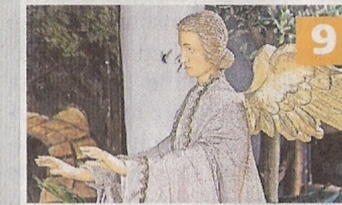
St. Sebastian Lobberich